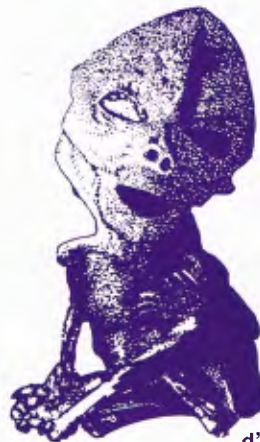
d'après une photo et un croquis de Jorge Martin dans FSR vol. 42, n°1

La tête du personnage est très volumineuse par rapport au reste du corps. Les bras sont aussi, proportionnellement, très longs. Les mains ont quatre doigts terminés par des ongles pointus en forme de pinces, et ces doigts sont reliés entre eux par une membrane. La peau, très dure, a une coloration